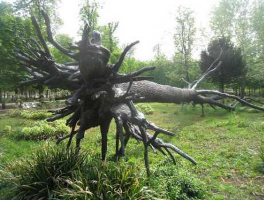
Görsel 5. Giuseppe Penone, L'albero delle vocali (Ünlüler Ağacı) (1999-2000), Paris'teki Tuileries Gardens'da.

Sanatçının L'albero delle vocali (Ünlüler Ağacı) (1999-2000) adlı eseri (Görsel 5), Paris'teki Tuileries Gardens'da kalıcı olarak kurulmuştur. Kamusal alanda sergilediği bu devasa ağaç, bir fırtına sonucu köklerinden sökülerek yerle bir edilmiş gibi görünmektedir. Ancak izleyicide düşünme ve sorgulamayı amaçlayan sanatsal bir yatırımdır. Doğaya hükmetmek istemeyen sanatçı, onu gözlemlemeyi ve sanatla ilişkilendirmeyi amaçladığını iddia etmektedir (Italianiaparigi, t.y.).