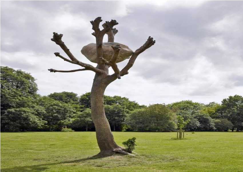
Görsel 7. Idee di Pietra (Ideas of Stone)” by Giuseppe Penone, Karlsaue Park, Kassel

Giuseppe Penone, çevrenin ve çevredeki peyzajın tasarımını göz önüne alarak sanatın, mimarinin, doğanın arasında bir diyalog yaratarak galeri içinde ve dışında sunulacak çalışmaları özenle seçmiştir. Kağıt üzerinde yapılan eserler, bronz ve mermerdeki büyük ölçekli eserler ve tek bir kum tanesinin hassas çoğaltılması, Penone'nin doğa sorunlarına duyduğu ilgiye dokunaklı bir rezonans verme bağlamda yer alır (Chateau la Coste).