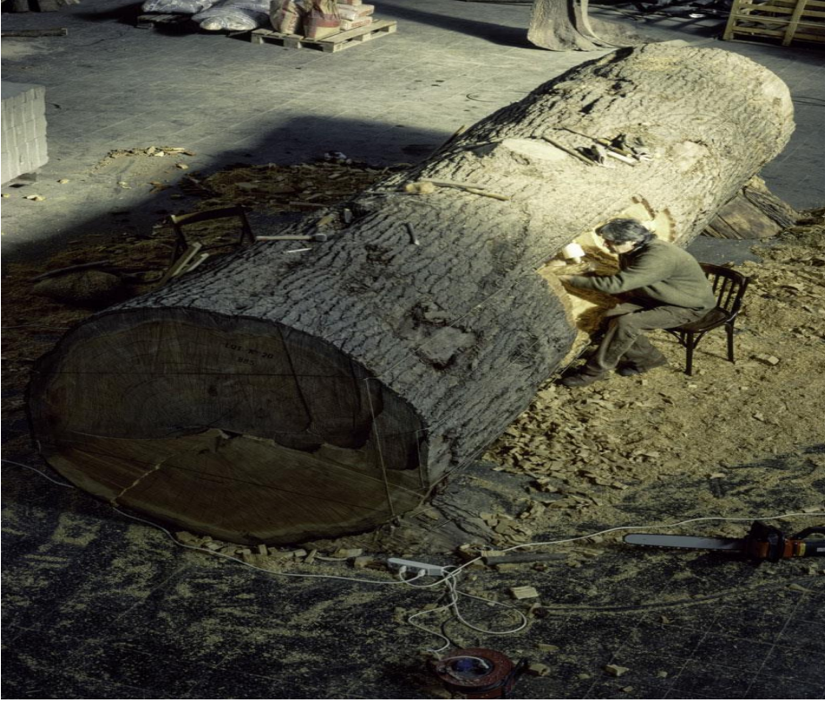
Görsel 2. Torino'daki stüdyosunda Cedro di Versailles (Versailles Cedar) (2000-2003) çalışmasında Giuseppe Penone (b. 1947)

Doğayla iç içe duygusal ve metafizik bağlantıları keşfetmiştir. Çalışmalarında kullandığı materyalle duygusal bir bağ kuran sanatçı, ahşabın nefes aldığını ve bunu kendisinin hissettiğini açıklamıştır. Bir eserin modernliğinin onun materyali ile ilgili olmadığını savunmuştur. Ona göre teknoloji insan etkinliği tarafından üretilen bir materyaldir oysa ağaç, kaya gibi materyaller ise değişken değildir ve sürekli bir varoluş, devamlılık gösterirler.