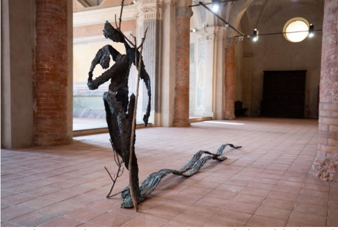
Görsel 10. Guiseppe Penone, Sebze Jestleri serisinden çalışma (1983-1986; bronz koleksiyon), Sergi görünümü, Boşluğun Olayları, San Francesco Kilisesi.

Kaynak: https://www.finestresullarte.info/opere-e-artisti/giuseppe-penone-incidenze-del-vuoto-arte-e-natura-ind