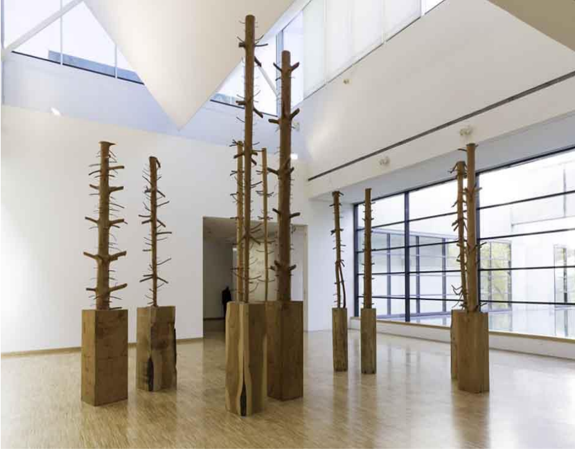
Görsel 6. Giuseppe Penone, Yinelenen Orman ( Ripetere il Bosco),1980-2014, Ahşap, Altı element, değişken boyutlar, kurulum görünümü, Musee de Grenoble,2014, 19 Eylül 2015

Ağaçları insanlarla eşleştiren Penone, ağaç heykelleri için; “Her şeyden önce, biri heykeltıraş olarak ve doğal malzeme ile çalışırsa, ona bir şekilde saygı duymaları gerekir. Madde ile çalışırsanız ona saygı göstermelisiniz. İçindeki ruhlara saygı göstermelisiniz. Çünkü malzemede her zaman bir ruh vardır.” ifadelerinde bulunmuştur.