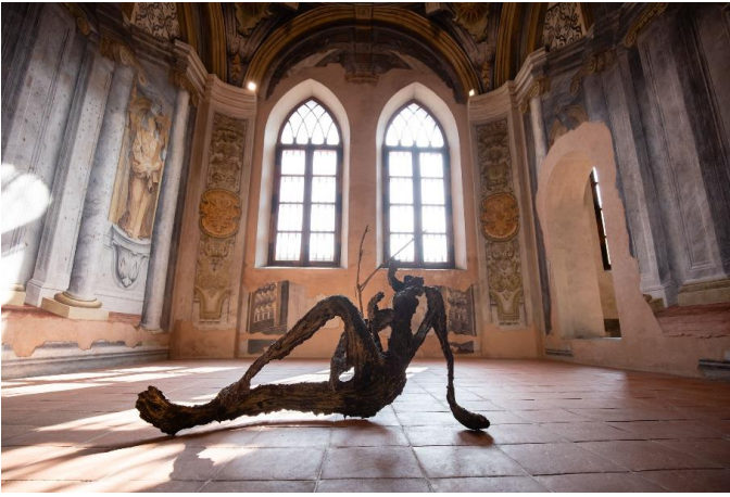
Görsel 11. Guiseppe Penone, Sebze Jestleri serisinden çalışma (1983-1986), Bronz koleksiyon, Sergi görünümü, Boşluğun Olayları, San Francesco Kilisesi.

Kaynak: https://www.finestresullarte.info/opere-e-artisti/giuseppe-penone-incidenze-del-vuoto-arte-e-natura-ind