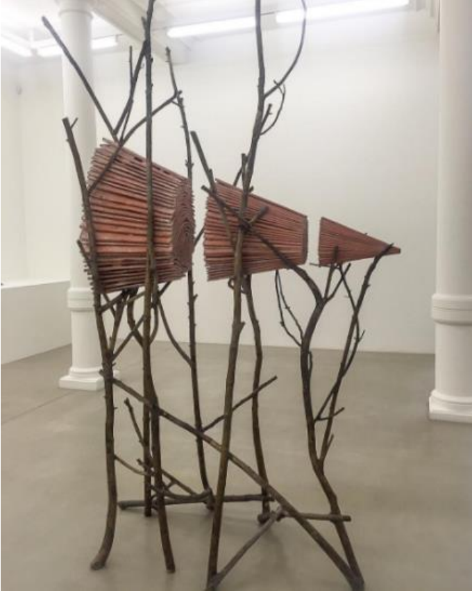
Görsel 8. Guiseppe Penone, Ombra di terra,1999, Tera cotta ve bronz,230x180x80 cm.

Doğal unsurlarla çeşitli metodolijik formlar yaratan sanatçının çoğu eserinde ağaç kalıpları, dikkatlice dengelenmiş dal çerçeveleri ve ahşap formlar sık sık yer almaktadır. “Ombra di terra” adlı eserinde de (Görsel 8) kıvrımlı ağaç formlarından oluşan heykel görünümü hissi veren bir yapı söz konusudur (Art Observed, 2016).