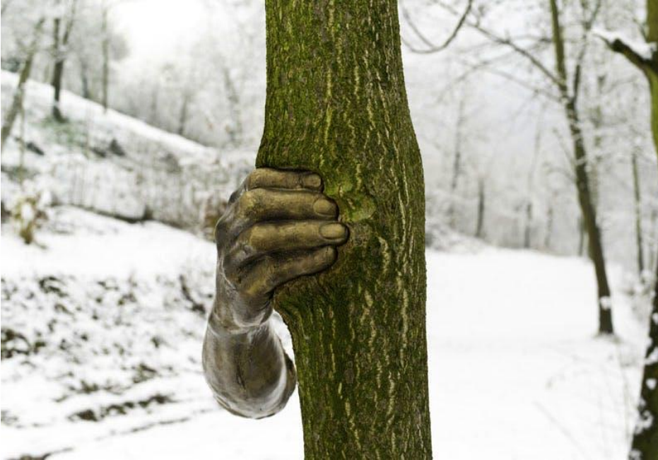
Görsel 3. Giuseppe Penone, Ağaç (Ailanthus altissima) Ve Bronz,2008, Fotoğraf

Doğayla iç içe duygusal ve metafizik bağlantıları keşfetmiştir. Çalışmalarında kullandığı materyalle duygusal bir bağ kuran sanatçı, ahşabın nefes aldığını ve bunu kendisinin hissettiğini açıklamıştır. Bir eserin modernliğinin onun materyali ile ilgili olmadığını savunmuştur. Ona göre teknoloji insan etkinliği tarafından üretilen bir materyaldir oysa ağaç, kaya gibi materyaller ise değişken değildir ve sürekli bir varoluş, devamlılık gösterirler.