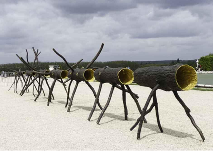
Görsel 4. Giuseppe Penone, Spazio di luce, Bronz ve Altın, Sekiz Element. Roma 2015, Gagosian Galerisi

Çalışmalarında sıklıkla yer alan ağaçların adeta uvuzları ve cildi vardır. Sade ve estetiksel dönüşümleriyle üretilen bu ağaç formlarında başka bir dönüşüm geçirmiş ancak devam etmekte olan bir yaşam söz konusudur.