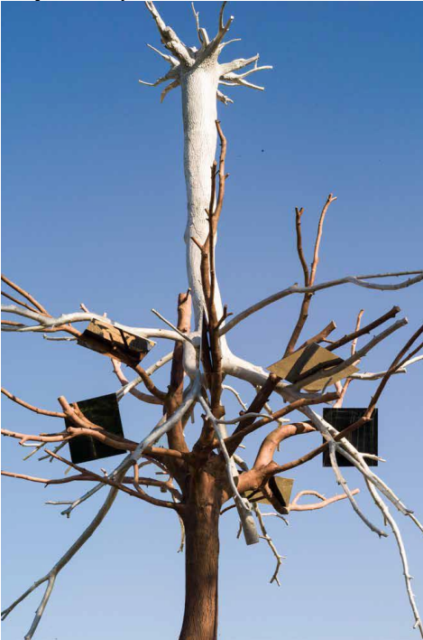
Görsel 12. Guiseppe Penone, Identita, 2017, Bronz, Çelik, 1257x730x610 cm, Özel Koleksiyon, Sergi Görünümü, Boşluğun Olayları.