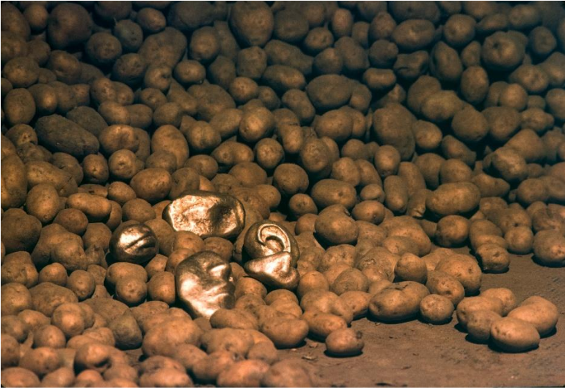
Görsel 9. Guiseppe Penone, Patates (Patates), 1977, Baden- Baden, Staatliche Kunsthalle.

Doğal unsurlarla çeşitli metodolijik formlar yaratan sanatçının çoğu eserinde ağaç kalıpları, dikkatlice dengelenmiş dal çerçeveleri ve ahşap formlar sık sık yer almaktadır. “Ombra di terra” adlı eserinde de (Görsel 8) kıvrımlı ağaç formlarından oluşan heykel görünümü hissi veren bir yapı söz konusudur (Art Observed, 2016).